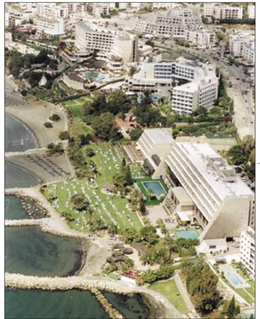
Zona turística en Limassol.

Este antagonismo cultural entre descendientes de griegos y turcos fue precisamente lo que alimentó la rivalidad entre ambos grupos. Ante una inminente guerra civil chipriota, la ONU tuvo que intervenir oportunamente, delimitando claramente las zonas sur y norte.